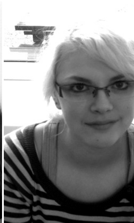
Mai jäi teisele kohale.