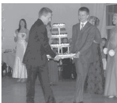
Ball kulmineerus maitstva tordiga.