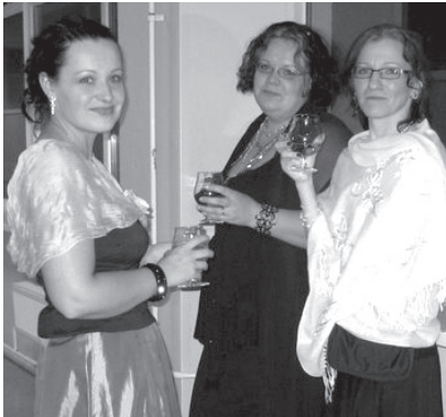
Vilistlaste väike jutu- ja puhkepaus.