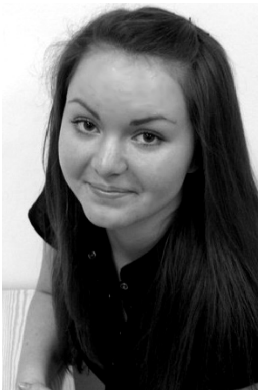
Kolmas koht neidu ei morjenda :)