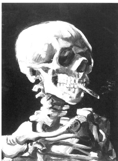
Vincent van Gogh "Skelett sigaretiga"