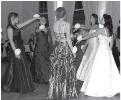
Neidude tants edelweiss.