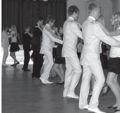
X klasside esinemine.