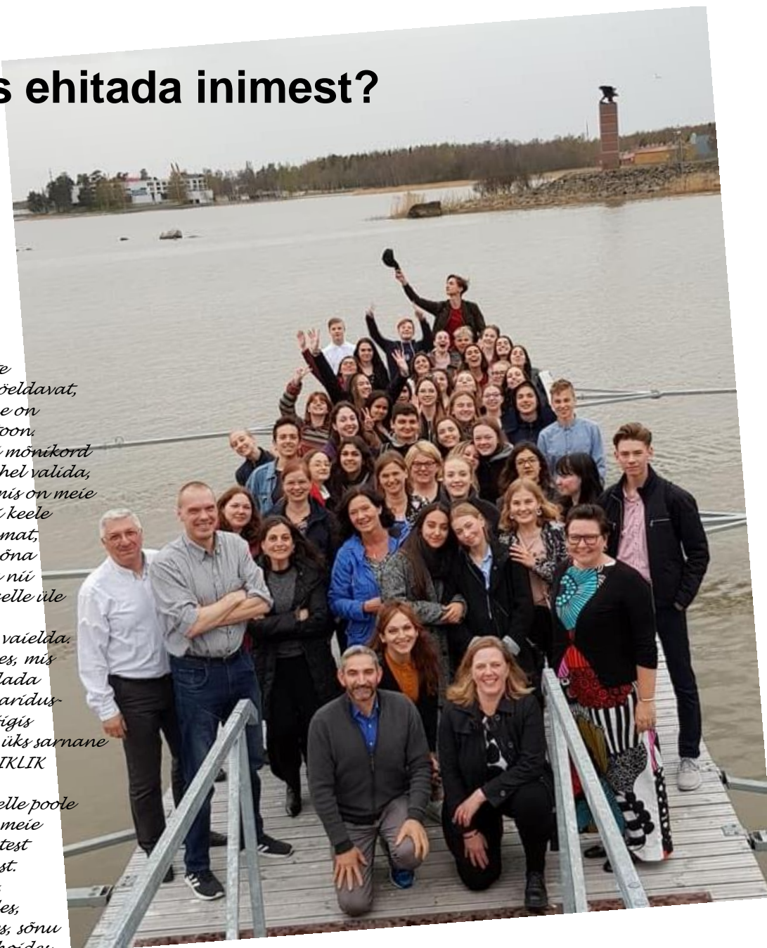
Foto: Ühispiilt projektireisilt Vaasa linna Soomes