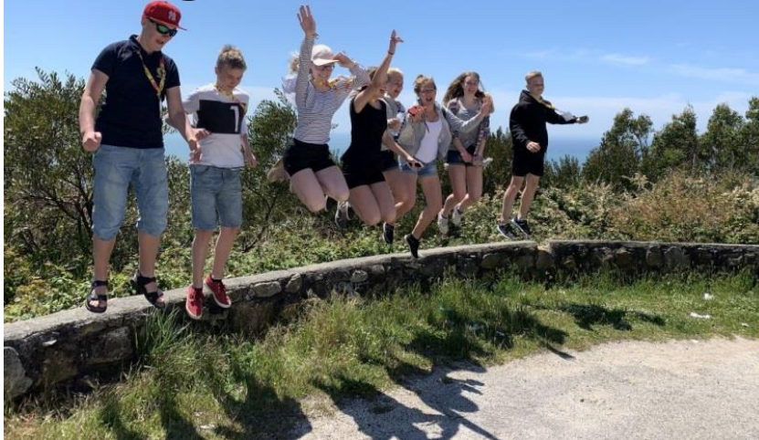
Mäe otsas müüri peal - tunnetame vabadust.

K ülastasime aprilli lõpus kaheksa õpilase ja kolme õpetajaga Erasmus+ Vaimse tervise alase projekti “Water - in and out. Our physical health” raames Portugali. Viibisime Montemor-O-Velho linnas, meie võõrustaja oli Agrupamento de Escolas. Kohtusime eakaaslastega Portugalist ja Prantsusmaalt ning elasime portugallaste peredes.