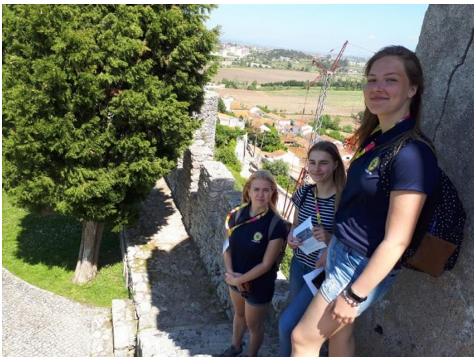
Montemori kindluse külastus oli põnev kõrvalpõige piirkonna ajalukku.