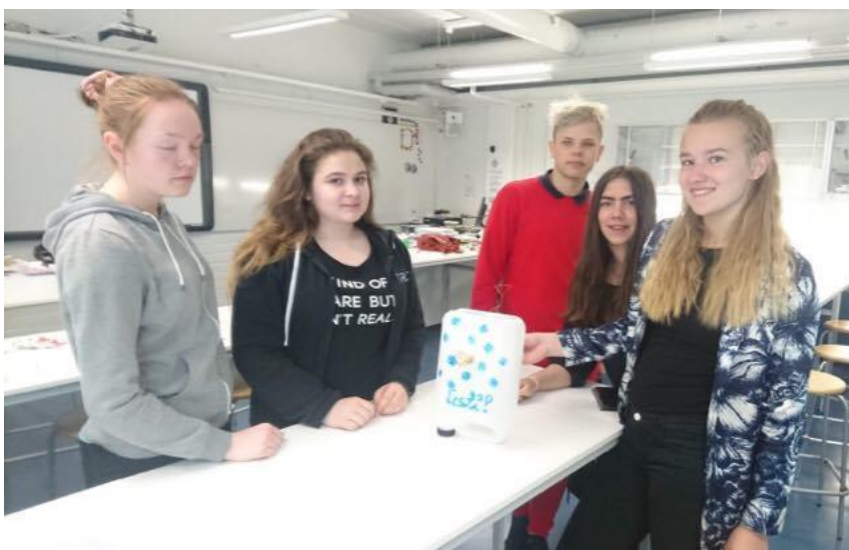
Tegime riigipõhistes rühmades hüdroelektrijaama.