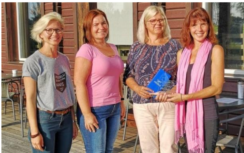
Vahetult enne 2018/2019. õppeaasta algust tunnustas SA Kiusamisvaba Kool meie Kuusalu keskkooli aasta kiusuennetaja tiitliga. Pildil Kuusalu Keskooli KiVa naiskond.

Lõppkokkuvõttes olid tulemused head, meie kooli õpetajad on kursis KiVaga ja tahavad seda edendada! Tunni lõpus küsisime, mida nemad siit kaasa võtavad, mis mängu nemad oma klassis läbi viivad. Enamus vali- sid Meeskonnaharjutuse . Melu ja